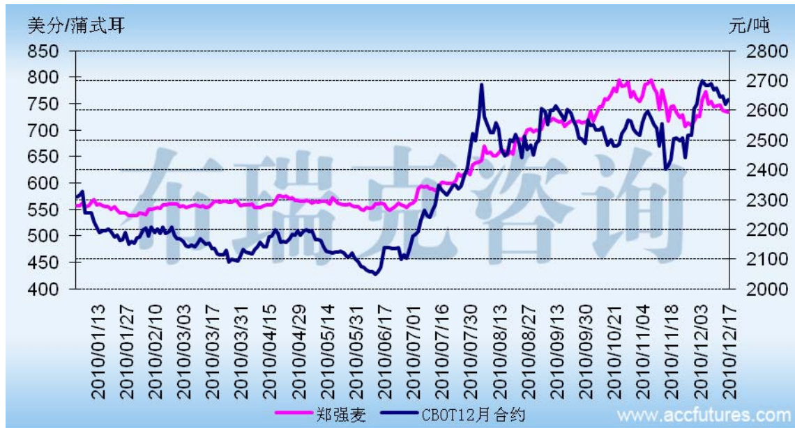
图 1. 101213 至 101217 当周内外盘小麦期货价格走势

12月13日—12月17日这周，郑粳稻本周震荡盘整。因现货市场购销平淡，基本稳定。具体来说，郑粳稻主力合约周二反弹上扬，随后回吐部分涨幅。周五收盘于2350元/吨，总体较上周收盘价略微上涨9元/吨。CBOT糙米期货整体趋弱，不断下跌。