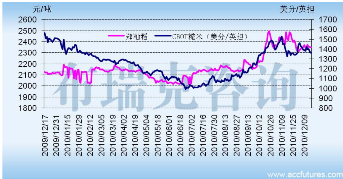
图 2. 101213 至 101217 当周内外盘稻米期货价格走势